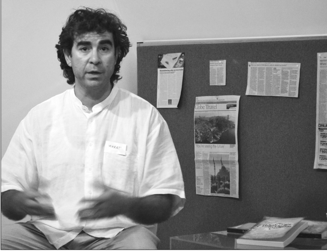
Yazar Murat Güvenç.