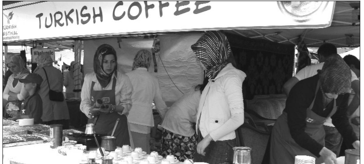
'Türk festival' panayırlarında sıkmabaşlı moderin kızların elinden Türk kahveler dağıtdı, Fethullah Gülen'in kitapları sergilendi..