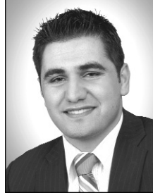
Av. Hüseyin Akyol L.L.L.

* Montréal'de etkinlik gösteren danışmanlık ve avukatlık büromuzda siz toplumumuzun hizmetindeyiz.