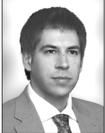
Av. Alexandre Bédard Arsenault L.L.L.